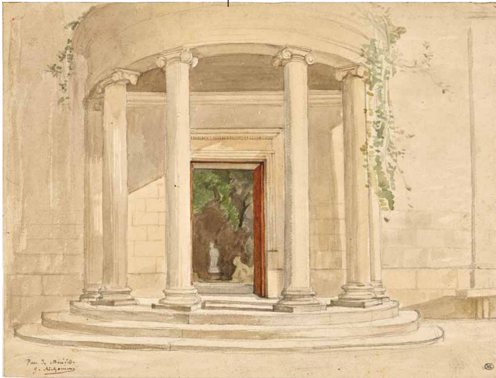
Jules Richomme, Péristyle à colonnes dans le parc de Méréville . Musée du Louvre.